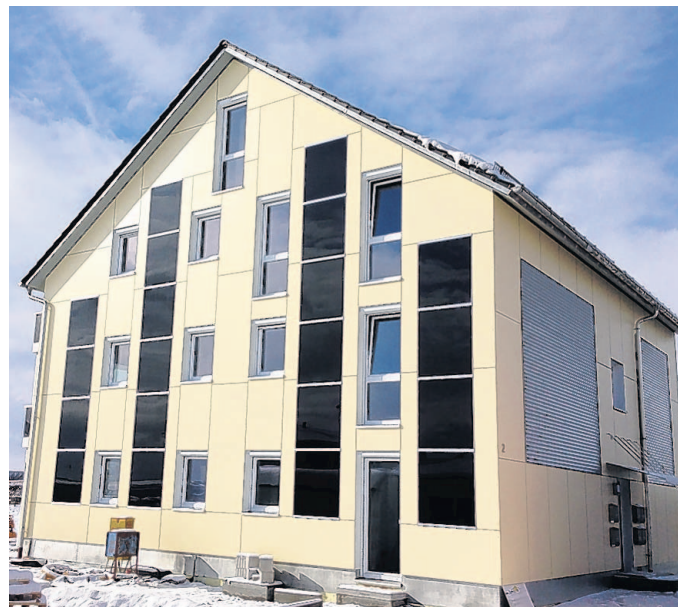
Das erste von drei Häusern im Untermeitingener Neubaugebiet ist jetzt bezugsfertig und kann am Samstag, 23. Februar, besichtigt werden. Es warten helle Räume und tolle Details auf die Besucher. Weitere Häuser entstehen in Klosterlechfeld.

Die Gebäudehülle, sprich die Fassade ist hier ein wesentlicher Faktor, der durch viele Erfahrungen stark optimiert werden konnte. So werden Langlebigkeit und maximaler Werterhalt erreicht. Die vorgehängte, hinterlüftete Fassade ist zwar in der Herstellung wesentlich teurer