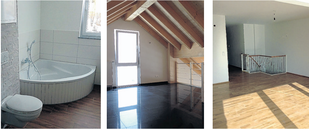
Die Räumlichkeiten sind hell und freundlich gestaltet. Die Eck-Badewanne ist ein Highlight im hellen Tageslichtbad.