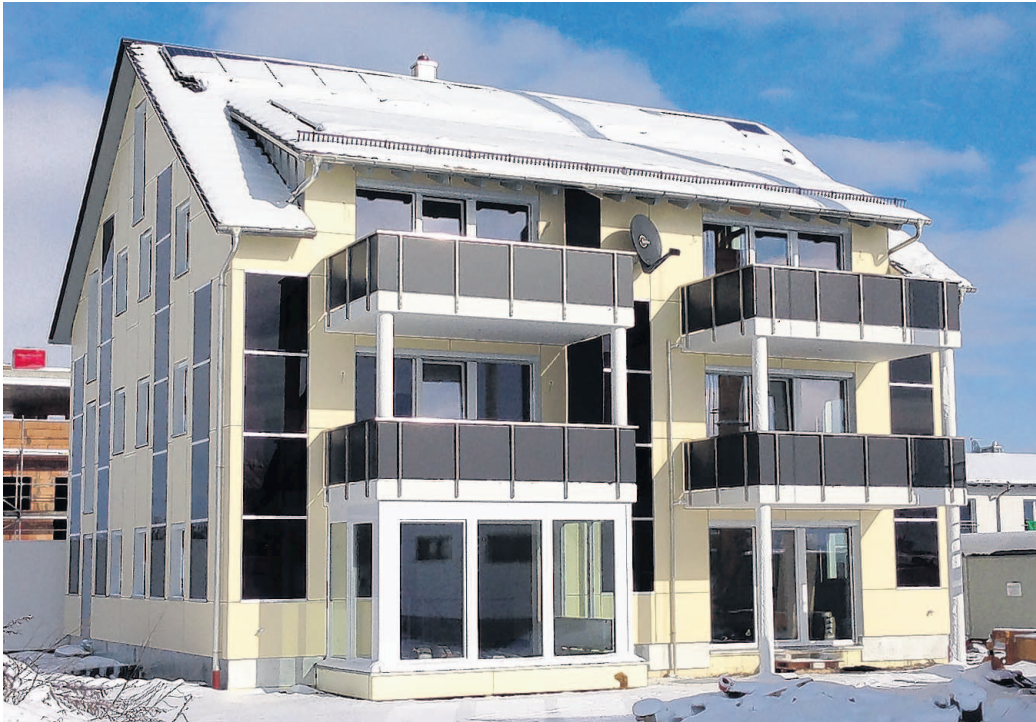
Die Süd-West-Ansicht der Neubauten in Untermeitingen im Januar 2013. Die Fotovoltaik-Module sind in die Fassade eingearbeitet.